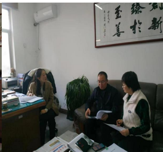
质评中心一行走访党政办公室