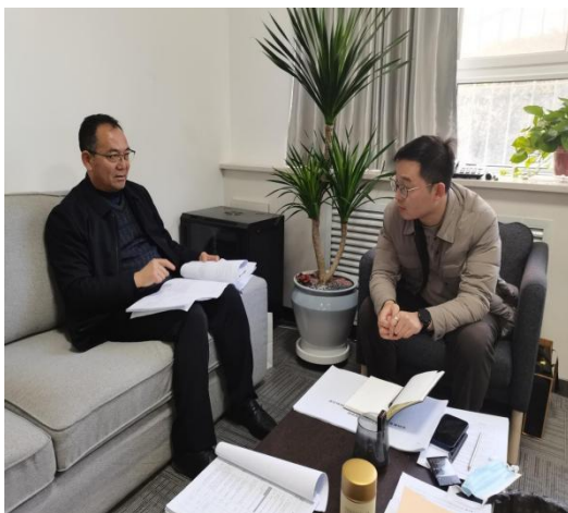
质评中心一行走访信息化中心