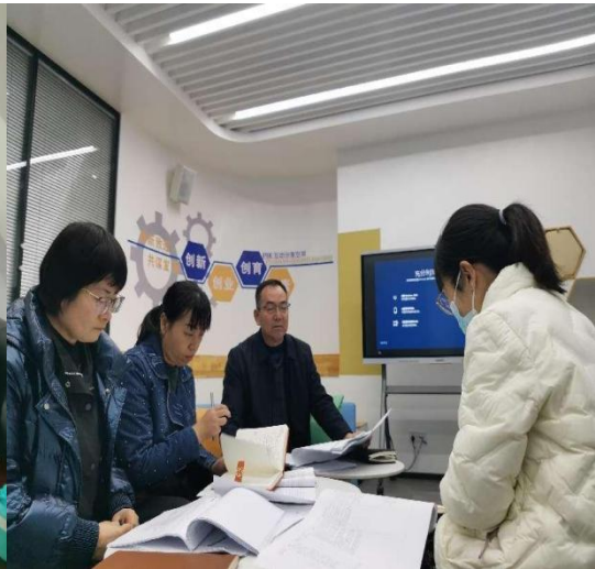
质评中心一行走访创新创业学院