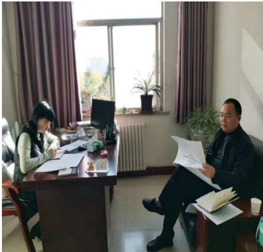
质评中心一行走访财务处