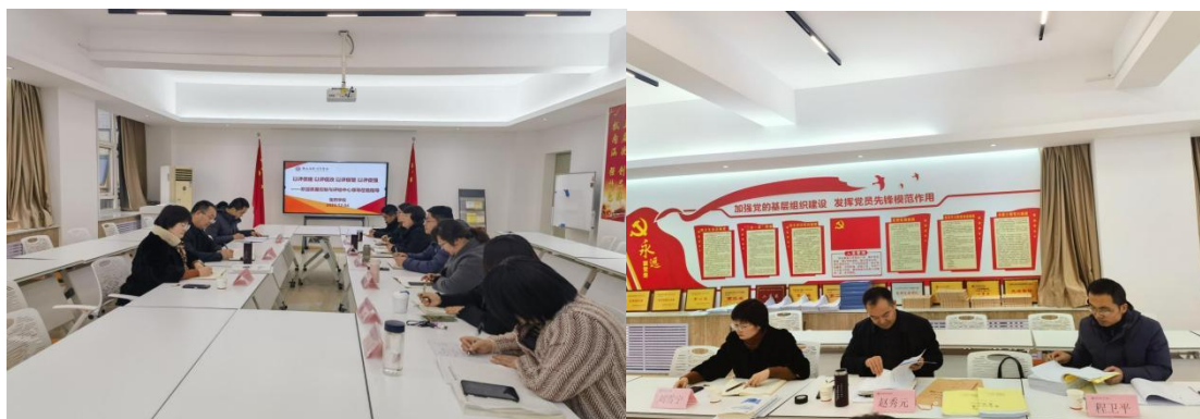
质评中心一行走访医药学院

定解决方案和举措，扎实开展自评自建工作。三是注重凝练特色。本次评估要认真总结学校办学优势特色，边自评边总结，做好资料归档，按照专业认证的标准认定人才培养方案，不断完善内外结合的质量保障与监控体系，保质保量完成评建工作。