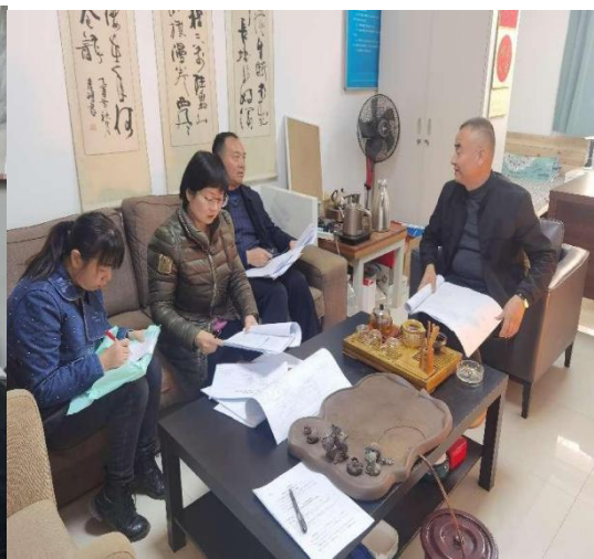
质评中心一行走访问基建处