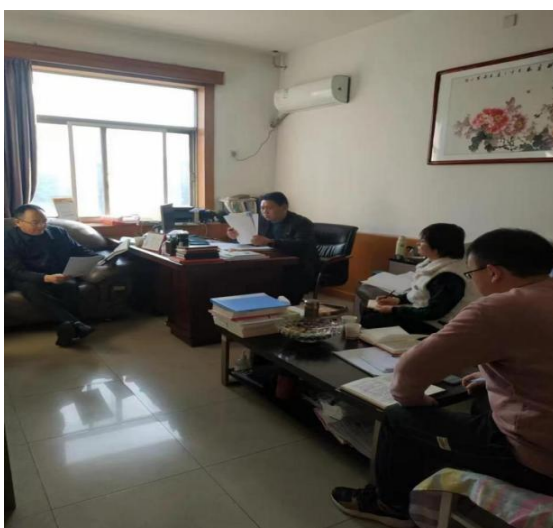
质评中心一行走访人力资源处