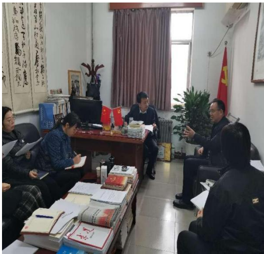
质评中心一行走访党委工作部