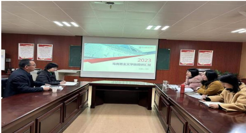
质评中心一行走访马克思主义学院

通过走访，质量控制与评估中心及各教学单位（部）深刻认识到：本科教育教学审核评估是对学校本科教育教学工作的全面考核和整体评价，需要全体师生员工的参与，学校要形成“人人关心评估，人人了解评估，人人参与评估，人人为迎评促建作贡献”的氛围，对于高效落实评建工作任务具有重要意义。各教学单位应以审核评估工作为契机，根据学校审核评估工作部署及要求，建立健全本单位审核评估评建工作领导小组、持续优化工作方案，深入进行调研、培训，配合组织问卷调查，撰写自评报告，凝练教育教学改革亮点和特色，形成教育教学示范案例。全体发动、全面准备、全员参与、总结优势、突出特色、分析问题、补足短板，落实国家本科教育教学新要求。