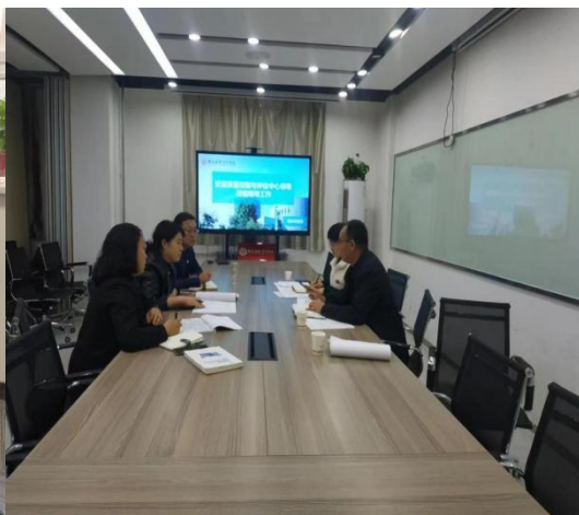
质评中心一行走访招生就业处