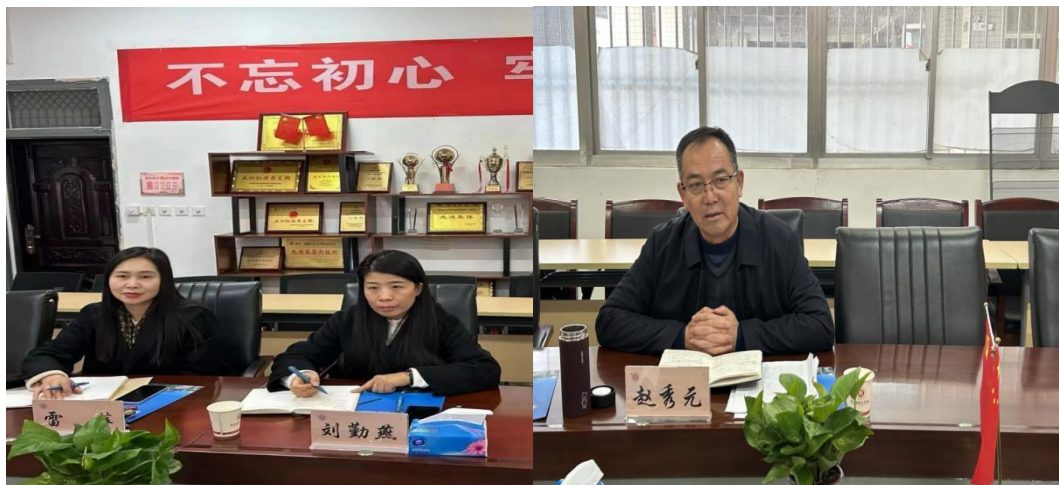
质评中心一行走访管理学院

会上,刘院长代表学院领导班子对质量控制与评估中心一行来到该院调研交流表示欢迎,并就学院本学期审核评估目前所做工作、审核评估重点工作和日常教学资料归档情况等方面进行了详细的介绍。